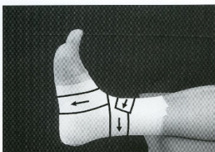
図 VI-B-231 フィギュアエイトテープ