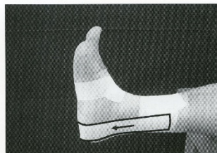
図 VI-B-232 スターアップテープ